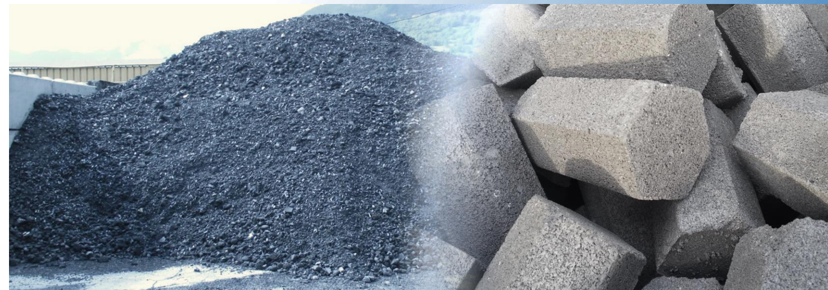
Production de briquettes à base de carbone et de silicium

Eco'Ring dispose d'un fort savoir faire pour la gestion des filières de valorisation de vos déchets dans le respect de la réglementation Européenne. Elle vous accompagnera dans l'exploitation et l'amélioration de procédés internes et/ou externes permettant une valorisation optimisée de vos déchets.